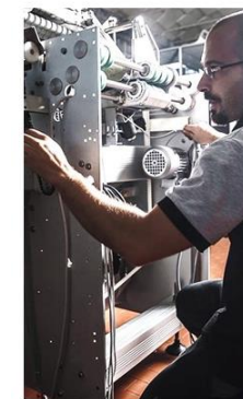
Manutenzione e Assistenza Ricambi