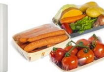
Film stretch certificati "bio-based" e "compostabile", neutri e stampati