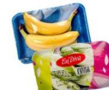
Film stretch neutri e stampati